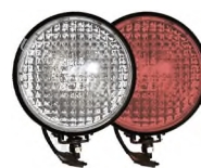
фары на СИМ